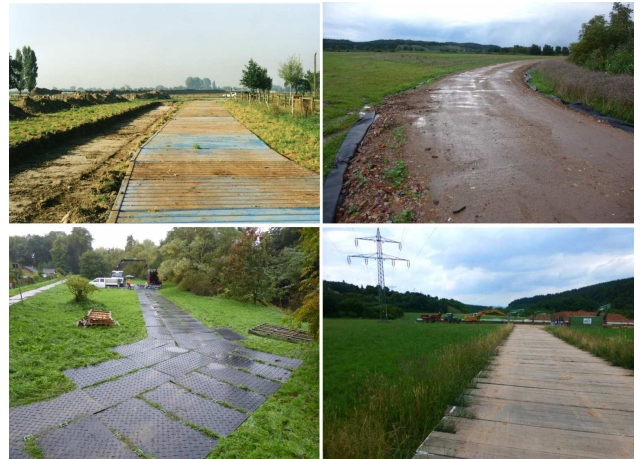
Auswahl geeigneter Befestigungssysteme.